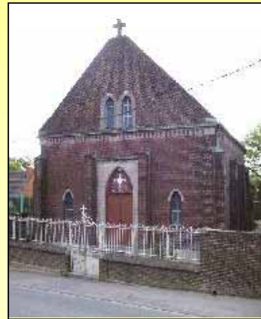
Montigny en Cambrésis