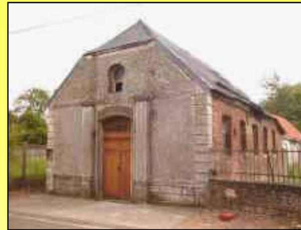
Elincourt 1837 (aujourd'hui démoli)