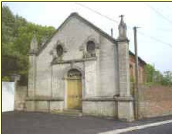
Caullery 1840 (en ruine)